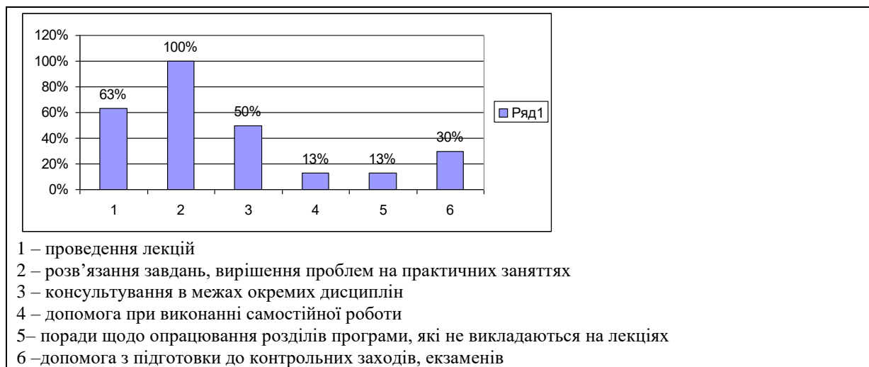
Рис.3 «Способи залучення до аудиторних занять на ОП професіоналів-практиків, експертів галузі, представників роботодавців».

Результати обраних здобувачами способів залучення до аудиторних занять на освітніх програмах професіоналів-практиків, експертів у галузі, представників роботодавців (Питання №23) представлені на рис.3.