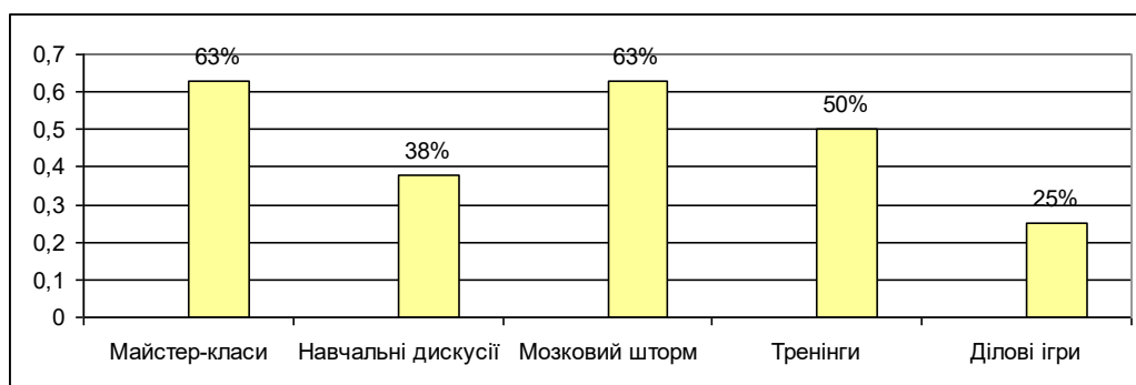
Рис. 1 «Чи використовували викладачі при викладанні навчальних дисциплін такі сучасні педагогічні методи?»

Розподіл відповідей на питання анкети №16 [Критерій 6] «Чи використовували викладачі при викладанні навчальних дисциплін такі сучасні педагогічні методи?» представлено на рис.1.